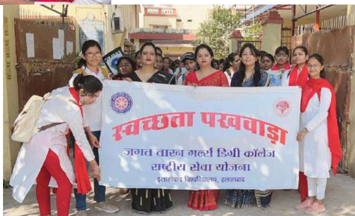
Swachhata Pakhwara Organized by NSS Units