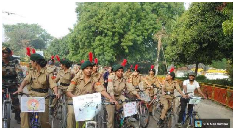
Bicycle Day Rally