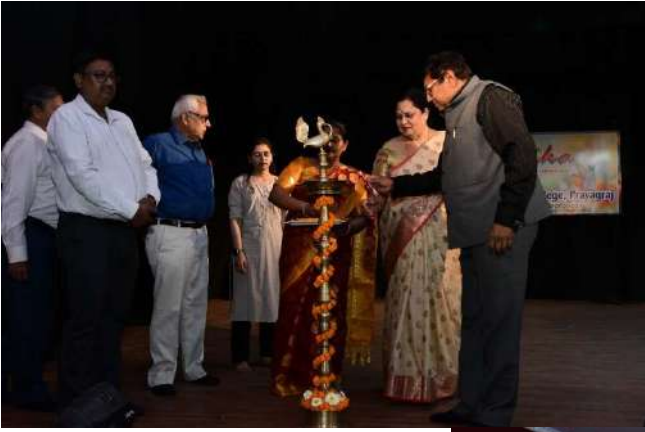
Formal Start of the Event by Lighting the Lamp