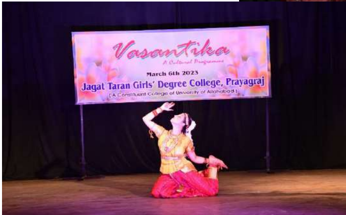
A Glimpse of Cultural Performances