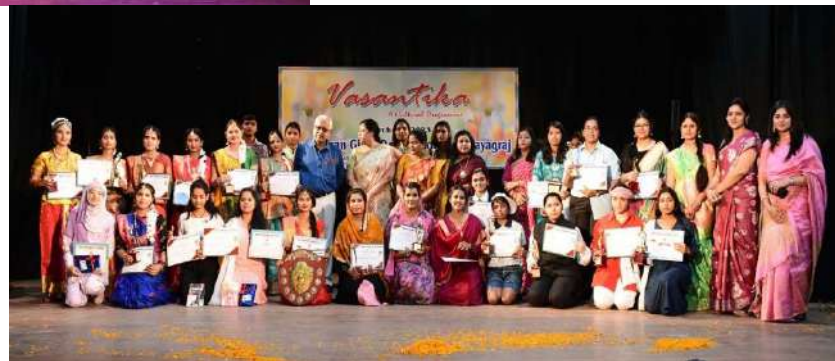
Felicitation of Academic Position Holders and Participants of Cultural Events